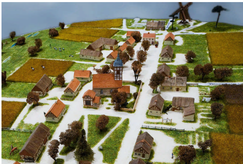
Die Lichterfelder Dorfaue um 1850.

2000 wurde der Kirchturm saniert, dabei wurden auch giftige Holzschutzmittel entfernt.