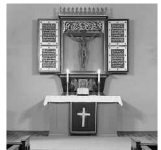
Der Altar aus Döberitz stand von 1941 bis 1993 in der Dorfkirche.

Blick von Norden (Steglitz) nach Süden. Links vor der Kirche steht das Spritzenhaus.