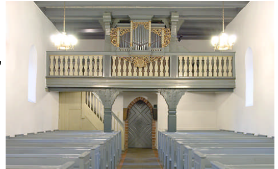
Die Schuke-Orgel der Dorfkirche von 1941.

Die Döberitzer Kirche wurde 1895 in einen Truppenübungsplatz einbezogen.