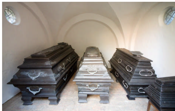
Die Gruft der Familie von Bülow befindet sich auf der Nordseite der Kirche.